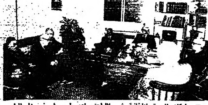
اركان الجبهة اللبنانية خلال اجتماعهم أمس في منزل الرئيس

مخدت الجبهة اللبنانية اجتماعها الدوري مساء أمس في منزل الرئيس سليمان خريجة بالقلعة. واستمر الاجتماع من الساعة الخامسة والنصف حتى الساعة الثامنة والربع، وكتب عنه الابائي شمرل قسيس. تصرح شمعون: وبعد الاجتماع قال الرئيس شمعون: